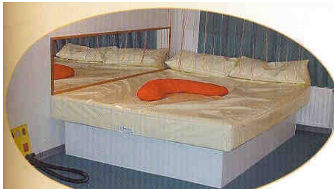
8005/ WZ110 COLCHÓN DE AGUA 8005/ OWZ100 BASE PARA COLCHÓN DE AGUA (HASTA 120 CM.)

Una cama de agua de calidad profesional debería formar parte de cualquier sala de estimulación. Los suaves movimientos y la sensación placentera de calidez de la cama estimula la sensación de bienestar, seguridad y relajación.